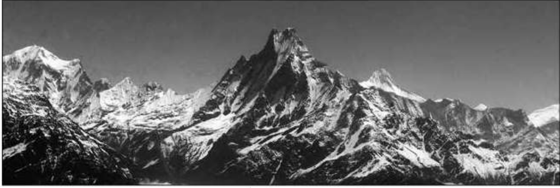
माछापुच्छ्रे हिमाल, गण्डकी

गणेश, गोरखा, अन्नपूर्ण, धवलागिरि, काञ्जिरोवा, अपी र सैपाल हिमशृङ्खलाअन्तर्गत विश्वका १० सर्वोच्च शिखरहरूमध्ये आठओटा हिमशिखरहरू पर्दछन् ।