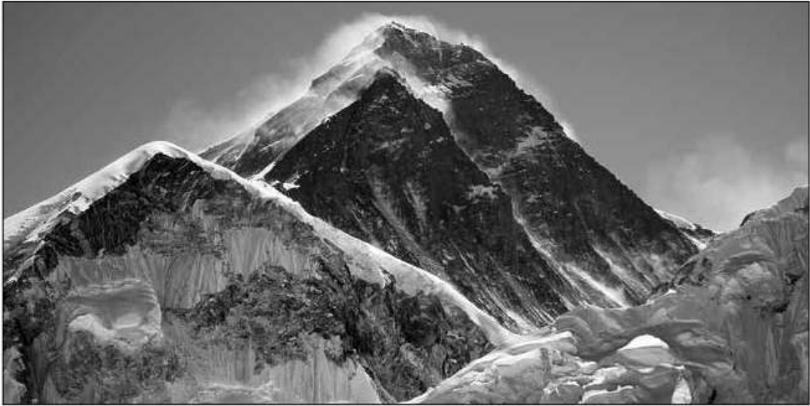
विश्वको सर्वोच्च शिखर सगरमाथा

हिमालयअन्तर्गतका उच्चतम चुलीहरू केन्द्रित मुख्य हिमालयमा ८,००० मिटरभन्दा अग्ला चुलीहरू पर्छन्। तटवर्ती हिमालयको दक्षिण रहेका बृहत्तर हिमाली शृङ्खलामा ६,००० मिटरभन्दा अग्ला १,३११ चुचुराहरू रहेका छन्। विश्वको सर्वोच्च शिखर सगरमाथा र तेस्रो उच्च हिमशिखर कञ्चनजङ्घाका अतिरिक्त ल्होत्से, मकालु, चो-ओयु, धवलागिरि, मनास्लु, अन्नपूर्णसमेत विश्वका दुई दर्जन चुलीमध्ये नेपालमा करिब डेढ दर्जन चुचुराहरू रहेका छन्। कञ्चनजङ्घा, खुम्बु, महालङ्गुर, रोल्वालिङ,